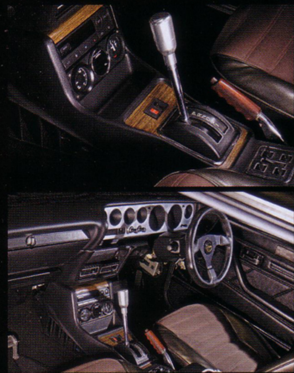
シフトレバー周辺まで、シンプルに目立たないように仕上げる心配りも忘れない。中身は最新で快適に、ルックスやビジュアルは当時の姿に仕上げるのがシブいところ。