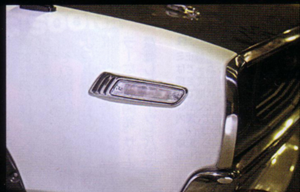
オーナーが製作したので詳細不明というが、リヤだけでなくウインカーなどもLED化。サイドのウインカーは定番のローレル用をホワイトにしたものだ。ちなみに、チラッと見えるボンネットはカーボン製。