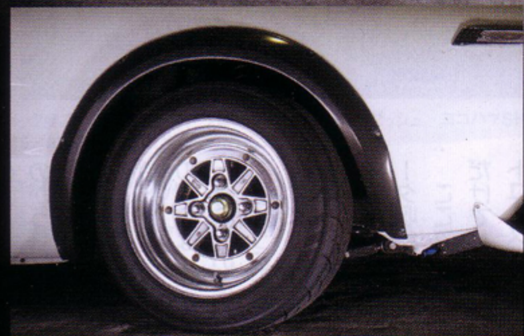
SSRのマーク3の中には、実はF3用のブレンボ(フロント)がおさまられ、リヤもディスクブレーキ化されている。さらにサスペンションキットはアラゴスタとスベックを聞くと旧車の物だとは思えない内容。